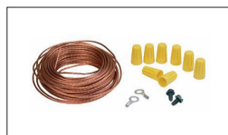
Réf : JW1053 Set de mise à la terre