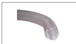
Réf : 10000315 Tuyau en PVC transparent Ø100mm à 2,5m