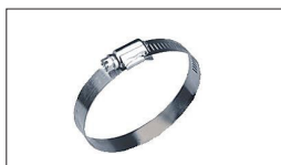
Réf : JW1022 Collier de serrage galvanisé Ø100mm